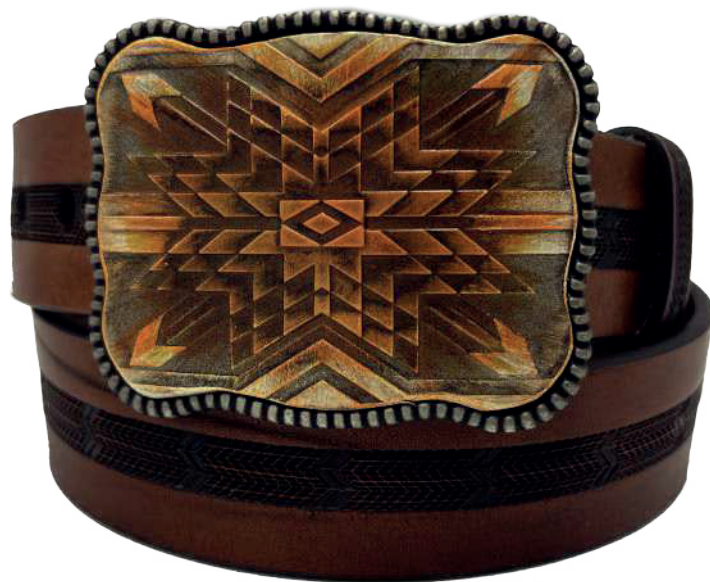
Modelo: 7507 Cinturón vaquero, sillero Colores: Firenze Ancho: 42 mm Tallas: 32-42