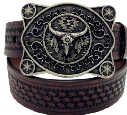
Modelo: 7510 Cinturón vaquero, sillero Colores: Café Ancho: 42 mm Tallas: 32-42