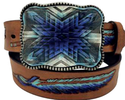
Modelo: 70224 Cinturón vaquero, sillero Colores: miel Ancho: 38 mm Tallas: 32-42