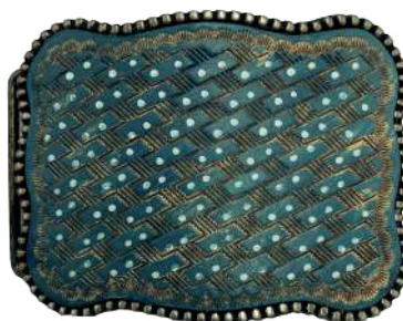
Estilo: HW-015 Hebilla forrada de piel y pintada a mano Ancho: 38 mm