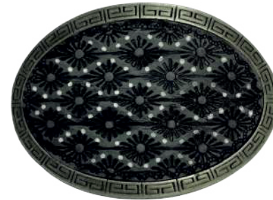
Estilo: HW-020 Hebilla forrada de piel y pintada a mano Ancho: 38 mm