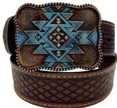
Modelo: 7523 Cinturón vaquero, sillero Colores: Teñido Ancho: 42 mm Tallas: 32-42