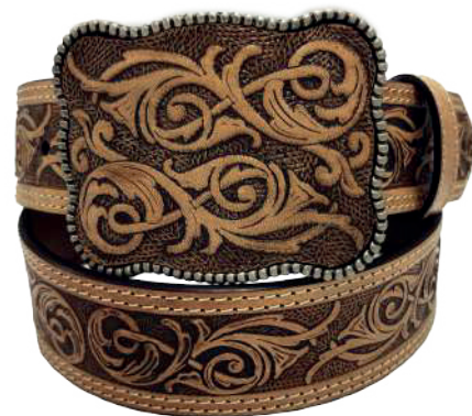
Modelo: 7531 Cinturón vaquero, sillero Colores: Natural Ancho: 42 mm Tallas: 32-42