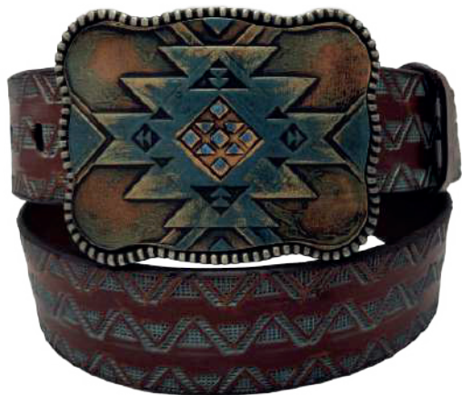
Modelo: 7500 Cinturón vaquero, sillero Colores: Firenze Ancho: 42 mm Tallas: 32-42