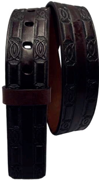
Modelo: 7520 Cinturón vaquero, sillero Colores: Café Ancho: 42 mm Tallas: 32-42