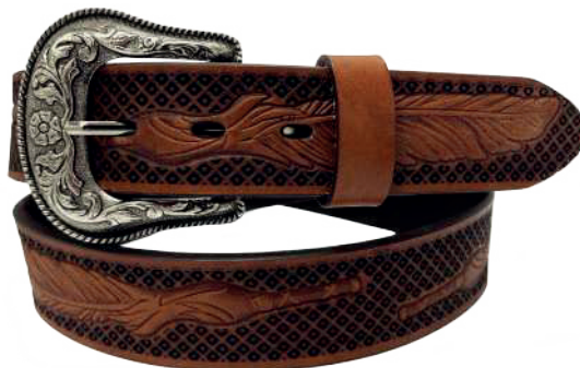
Modelo: 7024 Cinturón vaquero, sillero Colores: cognac Ancho: 38 mm Tallas: 32-42