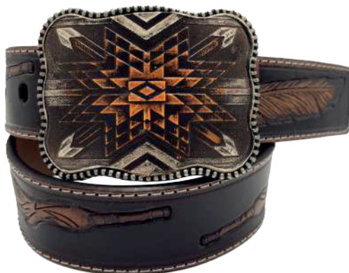
Modelo: 7518 Cinturón vaquero, sillero Colores: Miel Ancho: 42 mm Tallas: 32-42