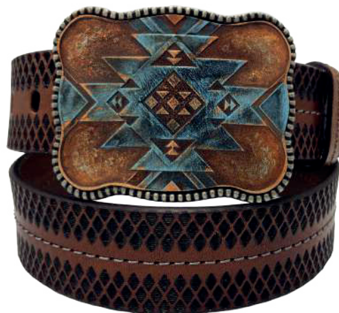
Modelo: 7504 Cinturón vaquero, silleró Colores: Firenze Ancho: 42 mm Tallas: 32-42