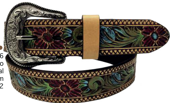
Modelo: 70056 Cinturón vaquero, sillero Colores: natural Ancho: 38 mm Tallas: 32-42