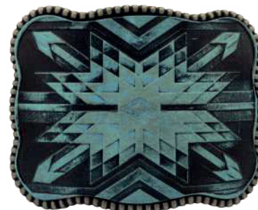
Estilo: HW-011 Hebilla forrada de piel y pintada a mano Ancho: 38 mm