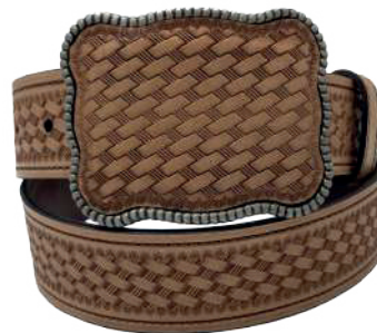
Modelo: 7535 Cinturón vaquero, sillero Colores: Natural Ancho: 42 mm Tallas: 32-42