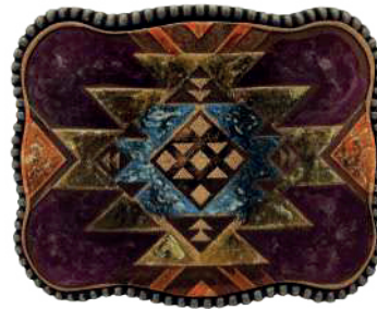
Estilo: HW-004 Hebilla forrada de piel y pintada a mano Ancho: 38 mm