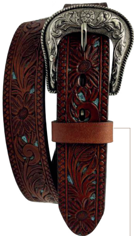
Modelo: 70054 Cinturón vaquero, sillero Colores: firence Ancho: 38 mm Tallas: 32-42