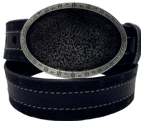
Modelo: 7515 Cinturón vaquero, sillero Colores: Negro Ancho: 42 mm Tallas: 32-42