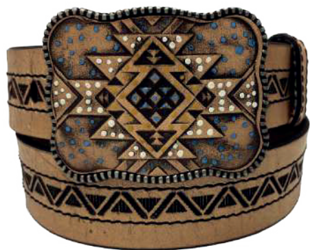
Modelo: 7517 Cinturón vaquero, sillero Colores: Natural Ancho: 42 mm Tallas: 32-42