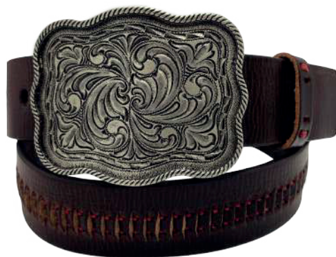
Modelo: 7509 Cinturón vaquero, sillero Colores: Naranja Ancho: 42 mm Tallas: 32-42