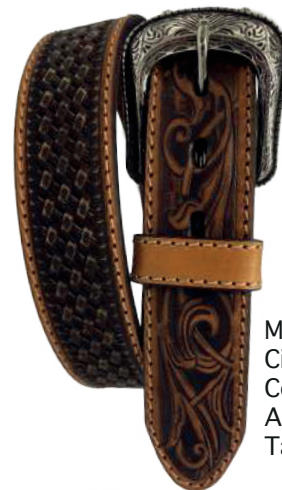
Modelo: 7030 Cinturón vaquero, sillero Colores: miel Ancho: 38 mm Tallas: 32-42