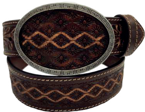
Modelo: 7529 Cinturón vaquero, sillero Colores: Teñido Ancho: 42 mm Tallas: 32-42