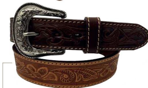
Modelo: 7025 ● Cinturón vaquero, sillero Colores: miel Ancho: 42 mm Tallas: 32-42