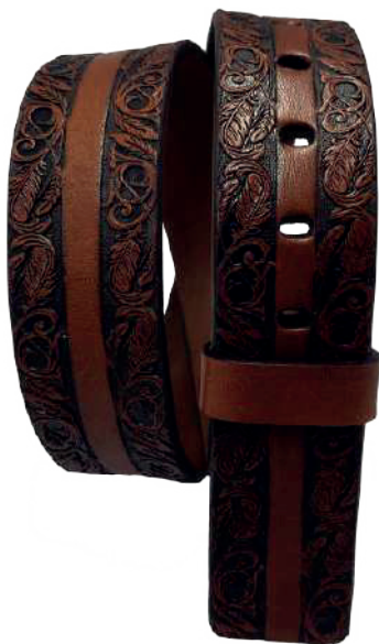
Modelo: 7508 Cinturón vaquero, sillero Colores: Firenze Ancho: 42 mm Tallas: 32-42