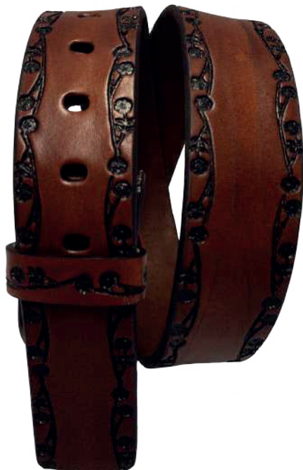
Modelo: 7506 Cinturón vaquero, sillero Colores: Firenze Ancho: 42 mm Tallas: 32-42