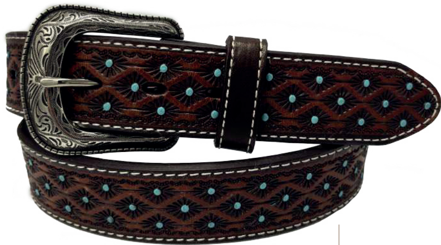
Modelo: 7001 Cinturón vaquero, sillero Colores: firence Ancho: 38 mm Tallas: 32-42