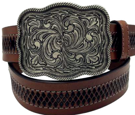
Modelo: 7501 Cinturón vaquero, sillero Colores: Firenze Ancho: 42 mm Tallas: 32-42