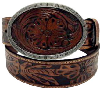
Modelo: 7532 Cinturón vaquero, sillero Colores: Firenze Ancho: 42 mm Tallas: 32-42