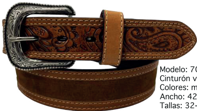
Modelo: 70083 Cinturón vaquero, sillero Colores: miel Ancho: 42 mm Tallas: 32-42