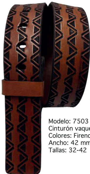
Modelo: 7503 Cinturón vaquero, silleró Colores: Firenze Ancho: 42 mm Tallas: 32-42