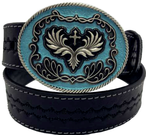
Modelo: 7514 Cinturón vaquero, sillero Colores: Negro Ancho: 42 mm Tallas: 32-42