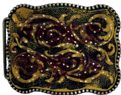
Estilo: HW-014 Hebilla forrada de piel y pintada a mano Ancho: 38 mm