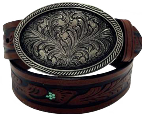
Modelo: 7524 Cinturón vaquero, sillero Colores: Firence Ancho: 42 mm Tallas: 32-42