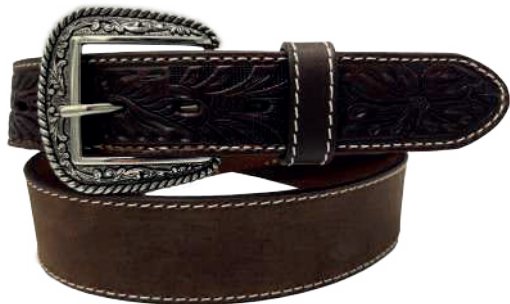
Modelo: 7026 Cinturón vaquero, sillero Colores: café Ancho: 42 mm Tallas: 32-42