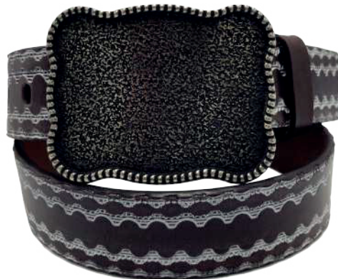
Modelo: 7512 Cinturón vaquero, sillero Colores: Café Ancho: 42 mm Tallas: 32-42