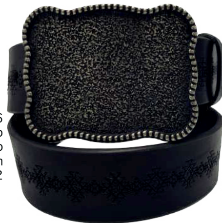
Modelo: 7516 Cinturón vaquero, sillero Colores: Negro Ancho: 42 mm Tallas: 32-42