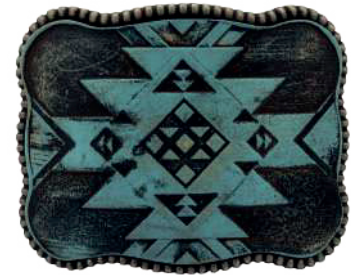
Estilo: HW-005 Hebilla forrada de piel y pintada a mano Ancho: 38 mm