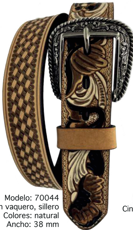
Modelo: 70044 Cinturón vaquero, sillero Colores: natural Ancho: 38 mm Tallas: 32-42