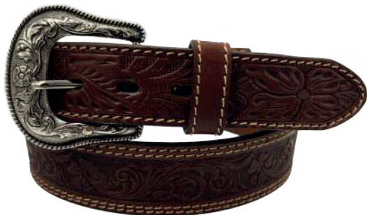
Modelo: 7027 Cinturón vaquero, sillero Colores: firence Ancho: 42 mm Tallas: 32-42