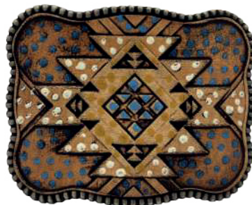
Estilo: HW-010 Hebilla forrada de piel y pintada a mano Ancho: 38 mm