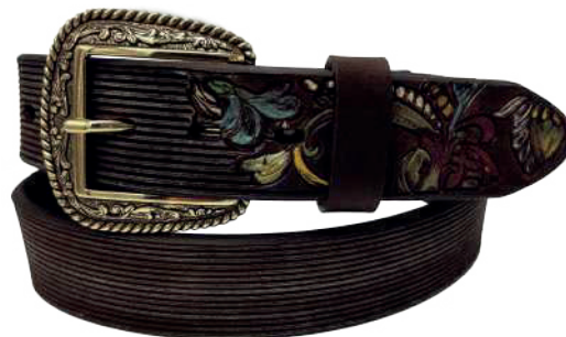
Modelo: 7021 Cinturón vaquero, sillero Colores: café Ancho: 38 mm Tallas: 32-42