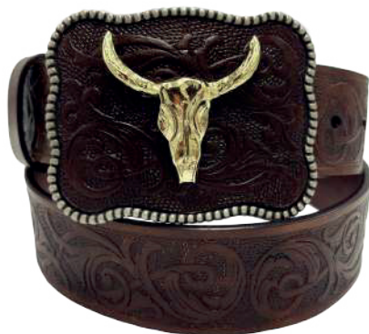
Modelo: 7537 Cinturón vaquero, sillero Colores: Café Ancho: 42 mm Tallas: 32-42