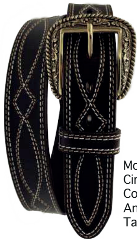
Modelo: 7031 Cinturón vaquero, sillero Colores: naranja Ancho: 38 mm Tallas: 32-42