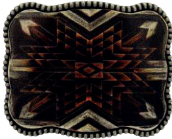
Estilo: HW-003 Hebilla forrada de piel y pintada a mano Ancho: 38 mm