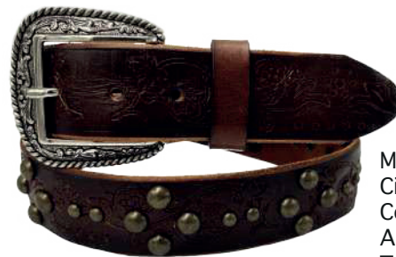
Modelo: 70202 Cinturón vaquero, sillero Colores: café Ancho: 38 mm Tallas: 32-42