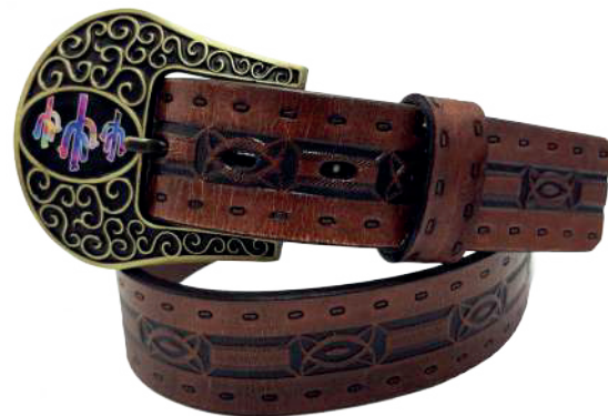
Modelo: 7525 Cinturón vaquero, sillero Colores: Cognac Ancho: 42 mm Tallas: 32-42