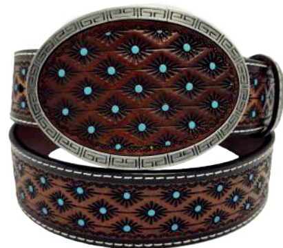
Modelo: 7528 Cinturón vaquero, sillero Colores: Firenze Ancho: 42 mm Tallas: 32-42