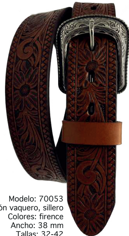
Modelo: 70053 Cinturón vaquero, sillero Colores: firence Ancho: 38 mm Tallas: 32-42