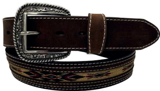
Modelo: 7015 Cinturón vaquero, sillero Colores: negro Ancho: 38 mm Tallas: 32-42