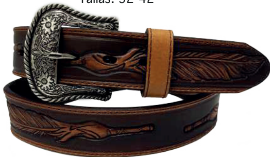
Modelo: 7023 Cinturón vaquero, sillero Colores: miel Ancho: 38 mm Tallas: 32-42