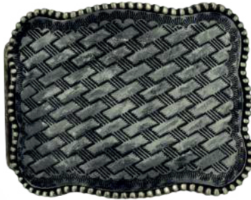
Estilo: HW-017 Hebilla forrada de piel y pintada a mano Ancho: 38 mm