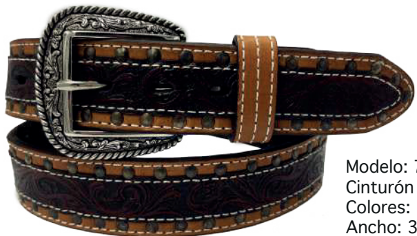
Modelo: 70094 Cinturón vaquero, sillero Colores: miel Ancho: 38 mm Tallas: 32-42