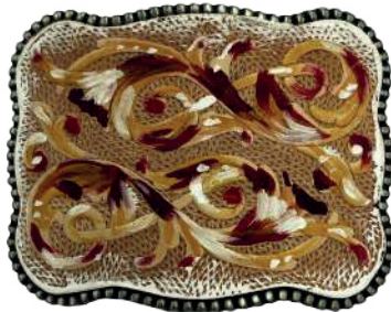
Estilo: HW-019 Hebilla forrada de piel y pintada a mano Ancho: 38 mm