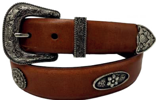
Modelo: 7018 Cinturón vaquero, sillero Colores: miel Ancho: 38 mm Tallas: 32-42