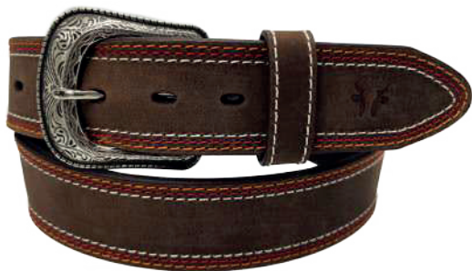
Modelo: 7002 Cinturón vaquero, sillero Colores: café Ancho: 42 mm Tallas: 32-42