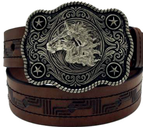
Modelo: 7521 Cinturón vaquero, sillero Colores: Firenze Ancho: 42 mm Tallas: 32-42