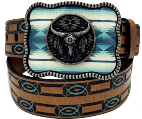
Modelo: 7522 Cinturón vaquero, sillero Colores: Miel Ancho: 42 mm Tallas: 32-42