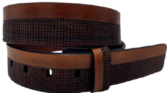
Modelo: 7526 Cinturón vaquero, sillero Colores: Cognac Ancho: 42 mm Tallas: 32-42