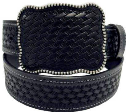
Modelo: 7536 Cinturón vaquero, sillero Colores: Negro Ancho: 42 mm Tallas: 32-42