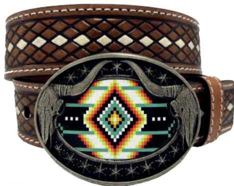
Modelo: 7527 Cinturón vaquero, sillero Colores: Teñido Ancho: 42 mm Tallas: 32-42