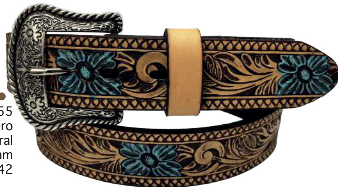
Modelo: 70055 Cinturón vaquero, sillero Colores: natural Ancho: 38 mm Tallas: 32-42