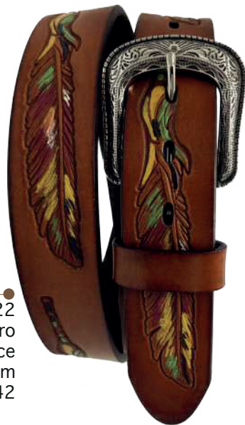
Modelo: 70222 Cinturón vaquero, sillero Colores: firence Ancho: 38 mm Tallas: 32-42