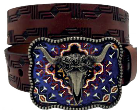
Modelo: 7519 Cinturón vaquero, sillero Colores: Shedron Ancho: 42 mm Tallas: 32-42