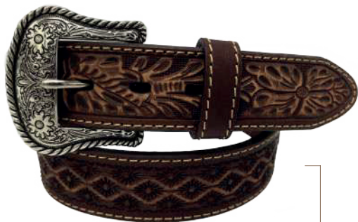
Modelo: 7029 ● Cinturón vaquero, sillero Colores: café Ancho: 38 mm Tallas: 32-42