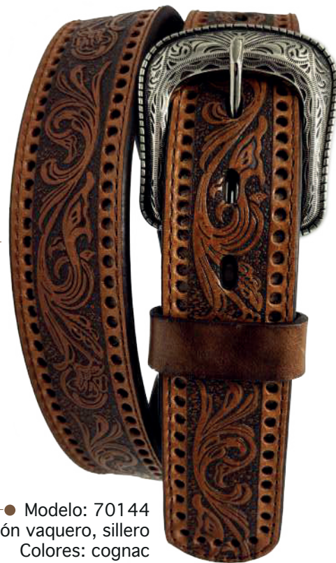
● Modelo: 70144 Cinturón vaquero, sillero Colores: cognac Ancho: 38 mm Tallas: 32-42