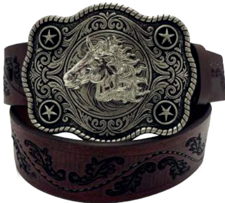
Modelo: 7511 Cinturón vaquero, sillero Colores: Café Ancho: 42 mm Tallas: 32-42