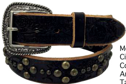
Modelo: 70201 Cinturón vaquero, sillero Colores: negro Ancho: 38 mm Tallas: 32-42