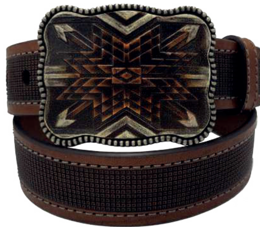
Modelo: 7505 Cinturón vaquero, silleró Colores: Firenze Ancho: 42 mm Tallas: 32-42