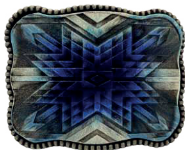
Estilo: HW-009 Hebilla forrada de piel y pintada a mano Ancho: 38 mm