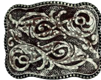
Estilo: HW-018 Hebilla forrada de piel y pintada a mano Ancho: 38 mm