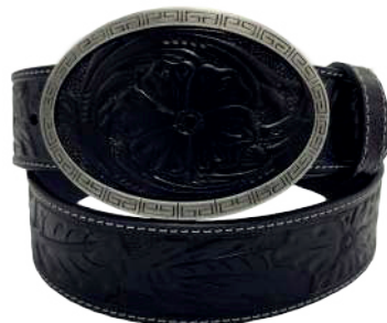
Modelo: 7533 Cinturón vaquero, sillero Colores: Negro Ancho: 42 mm Tallas: 32-42