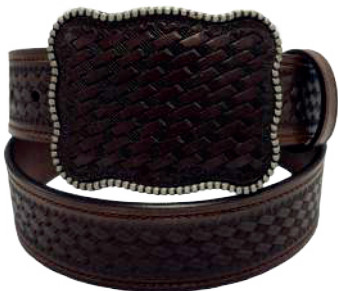
Modelo: 7534 Cinturón vaquero, sillero Colores: Café Ancho: 42 mm Tallas: 32-42