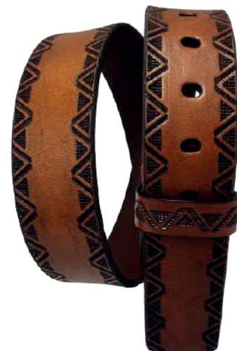
Modelo: 7502 Cinturón vaquero, sillero Colores: Firenze Ancho: 42 mm Tallas: 32-42