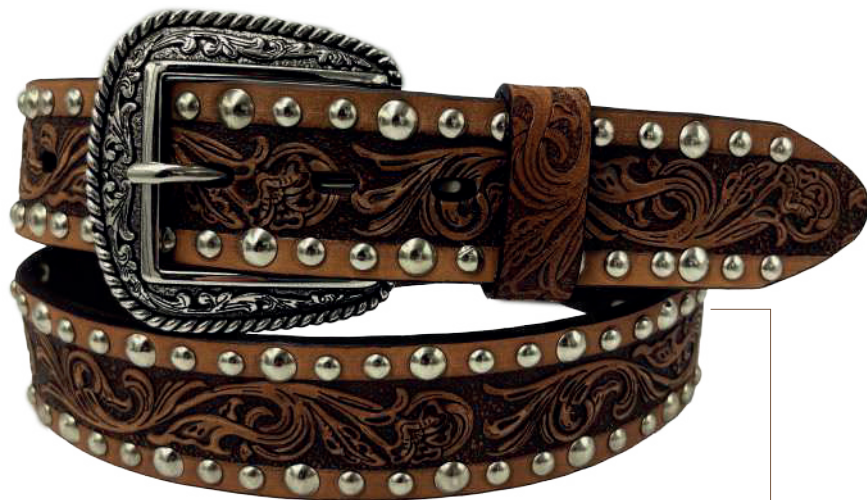
Modelo: 7028 ● Cinturón vaquero, sillero Colores: miel Ancho: 38 mm Tallas: 32-42