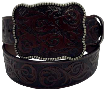
Modelo: 7530 Cinturón vaquero, sillero Colores: Café Ancho: 42 mm Tallas: 32-42