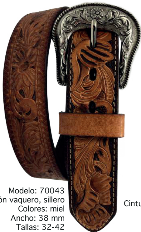
Modelo: 70043 Cinturón vaquero, sillero Colores: miel Ancho: 38 mm Tallas: 32-42