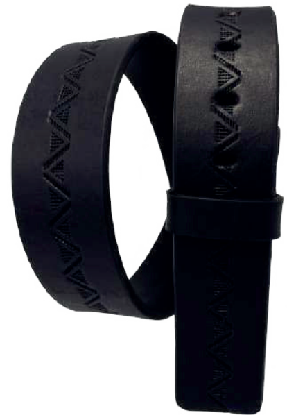
Modelo: 7513 Cinturón vaquero, sillero Colores: Negro Ancho: 42 mm Tallas: 32-42