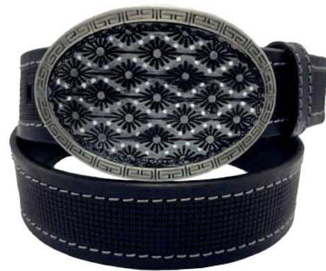
Modelo: 7538 Cinturón vaquero, sillero Colores: Negro Ancho: 42 mm Tallas: 32-42