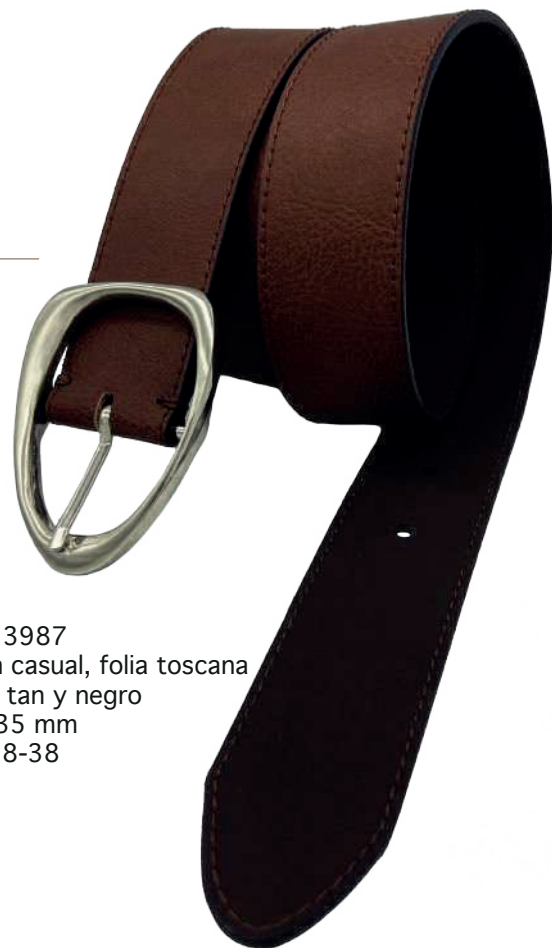
Modelo: 3987 Cinturón casual, folia toscana Colores: tan y negro Ancho: 35 mm Tallas: 28-38