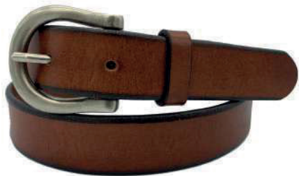
Modelo: 3090 Cinturón casual, vaqueta encino Colores: cognac Ancho: 25 mm Tallas: 28-38