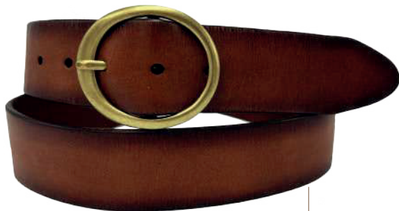
Modelo: 3245 Cinturón casual, vaqueta encino Colores: cognac, negro y café Ancho: 40 mm Tallas: 28-38