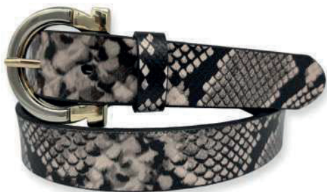
Modelo: 3011 Cinturón casual, folia Colores: n latte Ancho: 30 mm Tallas: 28-38