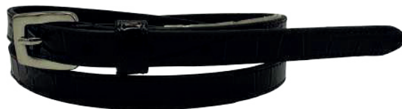
Modelo: 3790 Cinturón casual, folia lagarto Colores: negro Ancho: 15 mm Tallas: 28-38