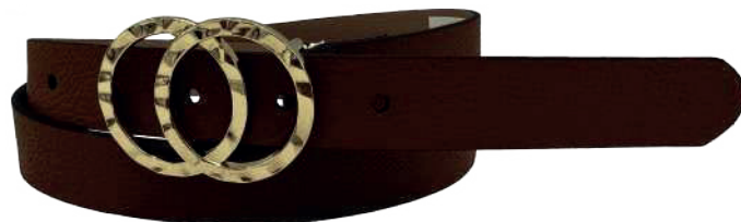
Modelo: 3787 Cinturón casual, folia texano Colores: camel Ancho: 25 mm Tallas: 28-38