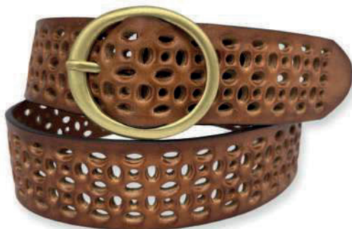
Modelo: 3451 Cinturón casual, vaqueta encino Colores: cognac, negro y café Ancho: 40 mm Tallas: 28-38