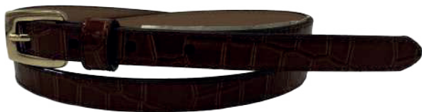
Modelo: 3789 Cinturón casual, folia lagarto Colores: armañac Ancho: 15 mm Tallas: 28-38