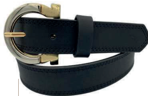
Modelo: 3485 Cinturón casual, folia olmeca Colores: negro y ferrero Ancho: 30 mm Tallas: 28-38