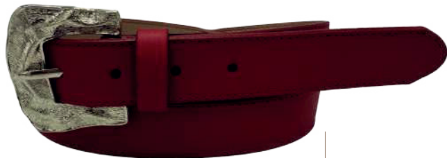
Modelo: 3788 Cinturón casual, folia nairobi Colores: negro, ferrero y rojo Ancho: 30 mm Tallas: 28-38