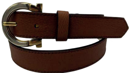
Modelo: 3994 Cinturón casual, folia texano Colores: camel y negro Ancho: 30 mm Tallas: 28-38