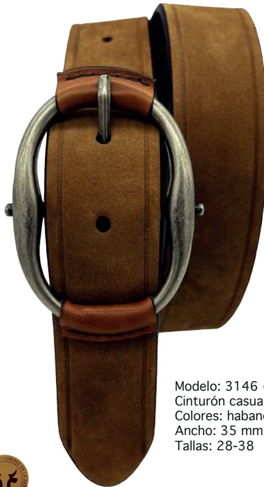
Modelo: 3146 Cinturón casual, piel nubuck Colores: habano y moka Ancho: 35 mm Tallas: 28-38