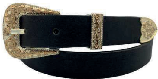
Modelo: 3755 Cinturón casual, folia ibérica Colores: cognac, negro y tan Ancho: 25 mm Tallas: 28-38