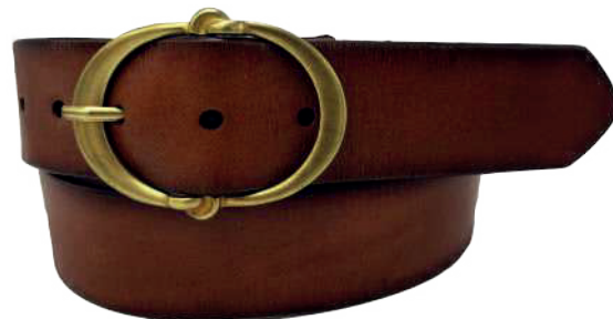
Modelo: 3271 Cinturón casual, vaqueta encino Colores: cognac, negro y café Ancho: 38 mm Tallas: 28-38