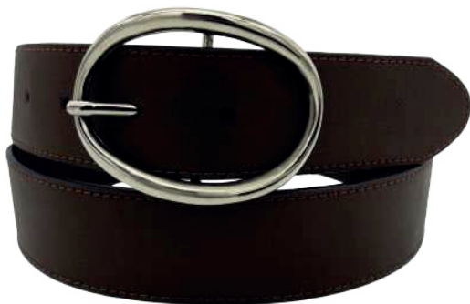
Modelo: 3986 Cinturón casual, folia zaragoza Colores: negro, toupe y cognac Ancho: 35 mm Tallas: 28-38