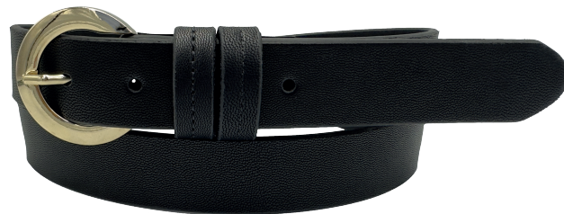
Modelo: 3792 Cinturón casual, folia Colores: negro Ancho: 30 mm Tallas: 28-38