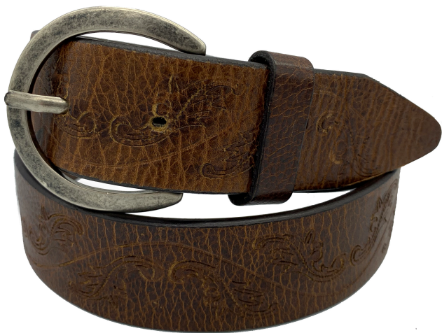
Modelo: 3043 Cinturón casual, piel sillero vegetal Colores: café Ancho: 35 mm Tallas: 28-38