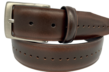
Modelo: 83603 Cinturón vestir, piel flor entera brush off Colores: miel Ancho: 38 mm Tallas: 30-44