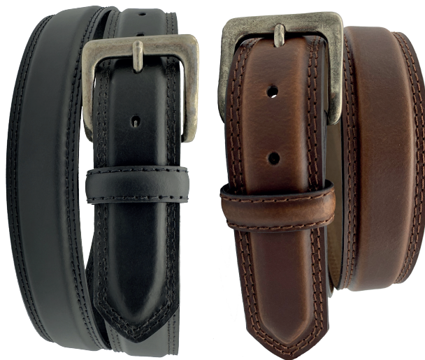
Modelo: 4310 Cinturón casual al corte, piel split Colores: cognac y negro Ancho: 38 mm Tallas: 30-44