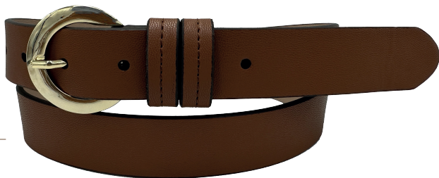
● Modelo: 3791 Cinturón casual, folia Colores: tan Ancho: 30 mm Tallas: 28-38