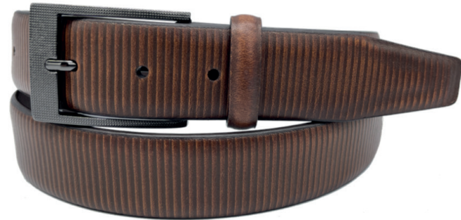
Modelo: 2756 Cinturón vestir, piel flor entera brush off Colores: miel Ancho: 35 mm Tallas: 30-44