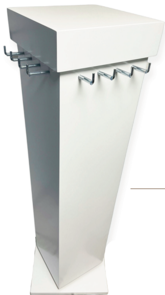
EXHIBIDOR GIRATORIO VERTICAL ●

Descripción: 4 ganchos por lado, giratorio. Material: madera MDF Color: blanco Medidas: 138 cm alto x 44 cm ancho