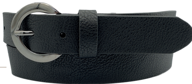
● Modelo: 3486 Cinturón casual, folia Colores: negro Ancho: 30 mm Tallas: 28-38