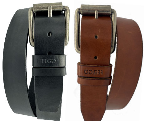
Modelo: 4191 Cinturón casual al corte, vaqueta vegetal Colores: negro y cognac Ancho: 38 mm Tallas: 30-44