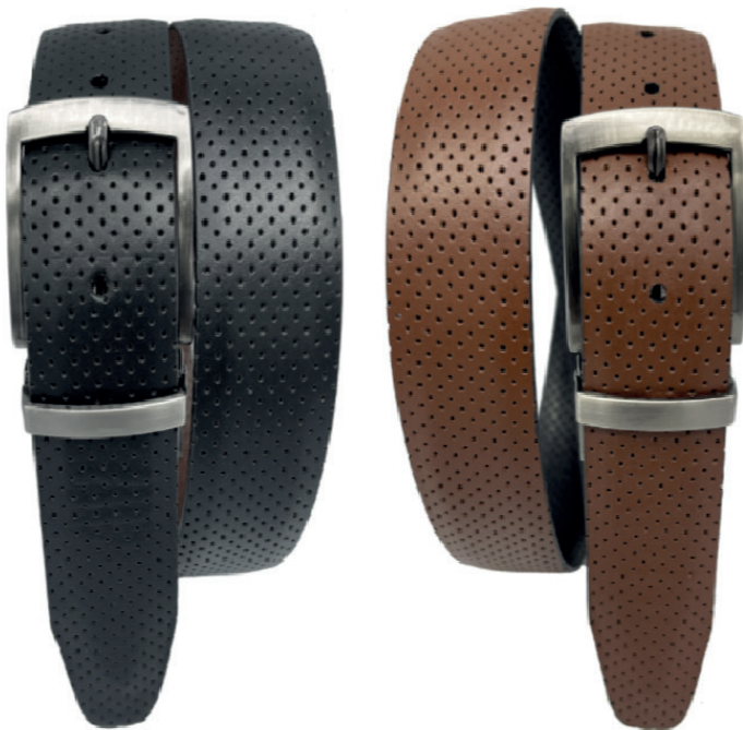
Modelo: 2115 Cinturón dos vistas vestir, piel flor entera Colores: negro / brandy Ancho: 35 mm Tallas: 30-44