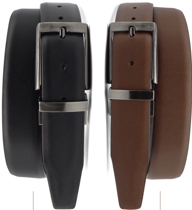
● Modelo: 2170 ● Cinturón dos vistas vestir, piel flor entera Colores: negro / expresso Ancho: 35 mm Tallas: 30-44