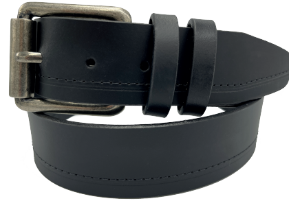
Modelo: 4179 Cinturón casual al corte, piel split Colores: negro y café Ancho: 38 mm Tallas: 30-44