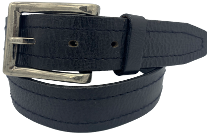
Modelo: 4189 Cinturón casual al corte, vaqueta vegetal Colores: negro Ancho: 42 mm Tallas: 30-44