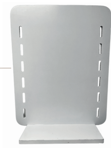
● EXHIBIDOR CON BASE HORIZONTAL

Descripción: 4 ganchos por lado, giratorio. Material: madera MDF Color: blanco Medidas: 138 cm alto x 44 cm ancho