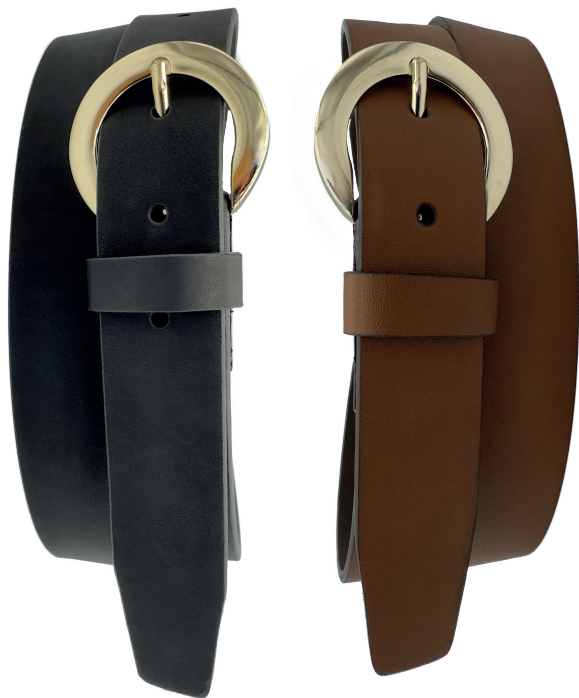
Modelo: 3481 Cinturón casual, folia Colores: negro y tan Ancho: 30 mm Tallas: 28-38