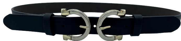
Modelo: 3299 Cinturón casual, folia Colores: negro Ancho: 30 mm Tallas: 28-38