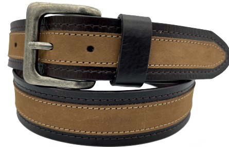
● Modelo: 4420 Cinturón casual al corte, piel split Colores: café / habano Ancho: 38 mm Tallas: 30-44