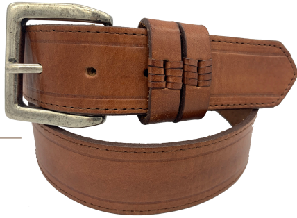
● Modelo: 4148 Cinturón casual al corte, vaqueta vegetal Colores: cognac Ancho: 38 mm Tallas: 30-44