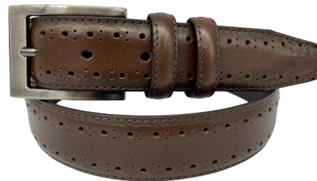
Modelo: 83602 Cinturón vestir, piel flor entera brush off Colores: café Ancho: 35 mm Tallas: 30-44