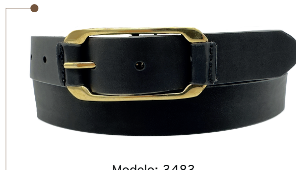
Modelo: 3483 Cinturón casual, folia Colores: ferrero y negro Ancho: 30 mm Tallas: 28-38