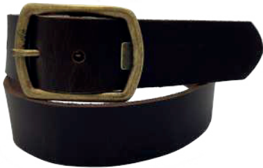
Modelo: 8014 Cinturón casual, Búfalo de agua Colores: Café Ancho: 38 mm Tallas: 32-42