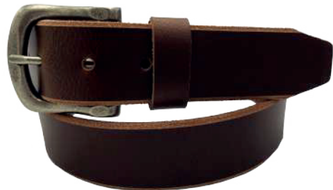
Modelo: 8009 Cinturón casual, Búfalo de agua Colores: Tan Ancho: 38 mm Tallas: 32-42