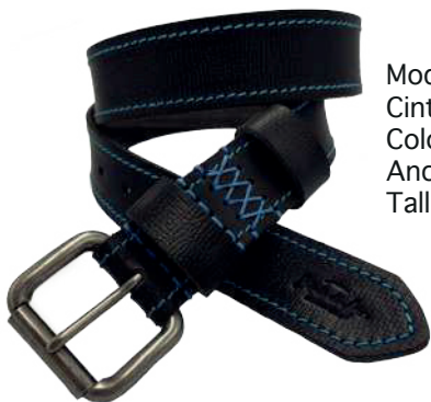
Modelo: 8002 Cinturón casual, Búfalo de agua Colores: Negro Ancho: 38 mm Tallas: 32-42