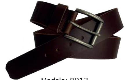
Modelo: 8013 Cinturón casual, Búfalo de agua Colores: Tan Ancho: 38 mm Tallas: 32-42