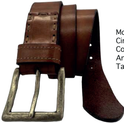
Modelo: 4188 Cinturón casual, vaqueta encino Colores: cognac, negro y café Ancho: 38 mm Tallas: 30-44