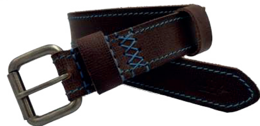
Modelo: 8002 Cinturón casual, Búfalo de agua Colores: Light Brown Ancho: 38 mm Tallas: 32-42