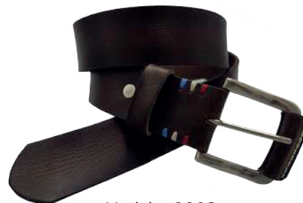
Modelo: 8003 Cinturón casual, Búfalo de agua Colores: Café Ancho: 38 mm Tallas: 32-42