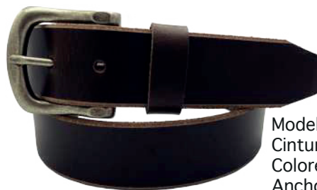
Modelo: 8009 Cinturón vaquero, Búfalo de agua Colores: Café Ancho: 38 mm Tallas: 32-42