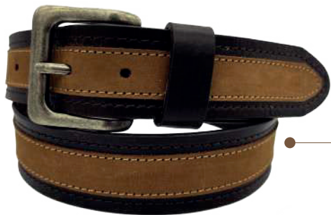
Modelo: 4420 Cinturón casual, piel split y nubuck Colores: café con habano Ancho: 38 mm Tallas: 30-44