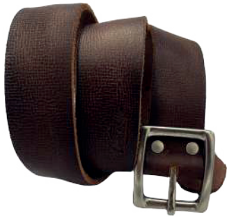
Modelo: 8011 Cinturón casual, Búfalo de agua Colores: Light Brown Ancho: 38 mm Tallas: 32-42