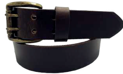
Modelo: 8012 Cinturón casual, Búfalo de agua Colores: Café Ancho: 38 mm Tallas: 32-42