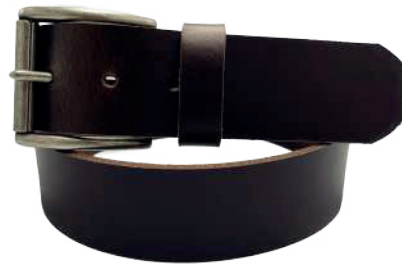
Modelo: 8013 Cinturón casual, Búfalo de agua Colores: Café Ancho: 38 mm Tallas: 32-42