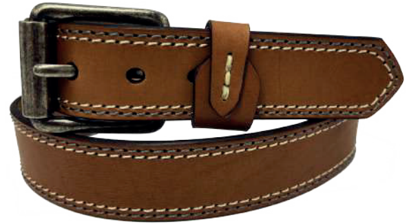
Modelo: 4190 Cinturón casual, vaqueta encino Colores: cognac, negro y café Ancho: 38 mm Tallas: 30-44