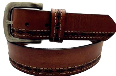
Modelo: 4595 Cinturón casual, vaqueta urka Colores: Cognac, negro y café Ancho: 38 mm Tallas: 30-44