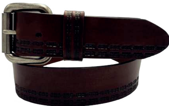
Modelo: 4598 Cinturón casual, vaqueta urka Colores: Cognac, negro y café Ancho: 38 mm Tallas: 30-44