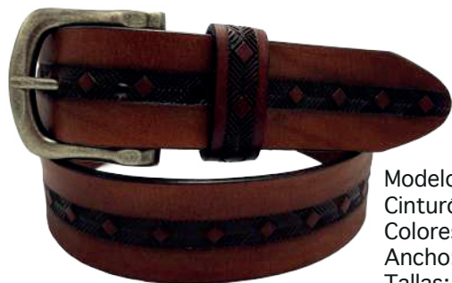
Modelo: 4590 Cinturón casual, vaqueta urka Colores: Cognac, negro y café Ancho: 38 mm Tallas: 30-44