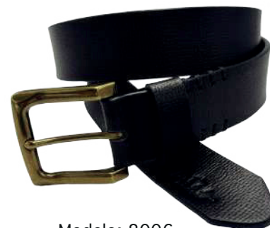
Modelo: 8006 Cinturón casual, Búfalo de agua Colores: Negro Ancho: 38 mm Tallas: 32-42