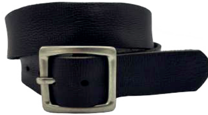
Modelo: 8011 Cinturón casual, Búfalo de agua Colores: Negro Ancho: 38 mm Tallas: 32-42