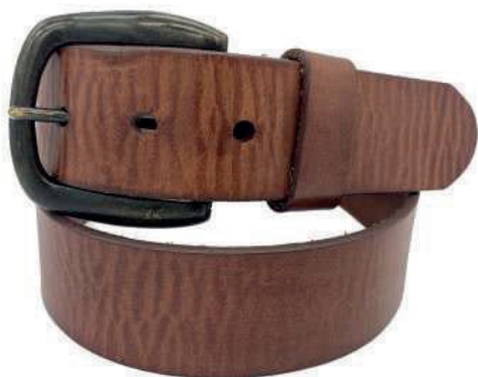
Modelo: 4147 Cinturón casual, vaqueta encino Colores: cognac, negro y café Ancho: 38 mm Tallas: 30-44