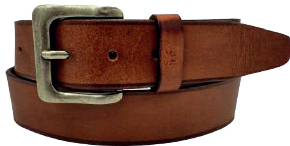
Modelo: 4185 Cinturón casual, vaqueta encino Colores: cognac, negro y café Ancho: 38 mm Tallas: 30-44