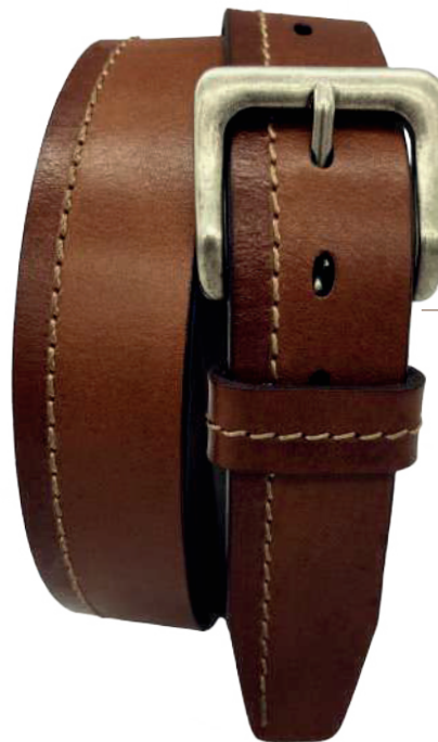
Modelo: 4175 Cinturón casual, vaqueta encino Colores: cognac, negro y café Ancho: 38 mm Tallas: 30-44