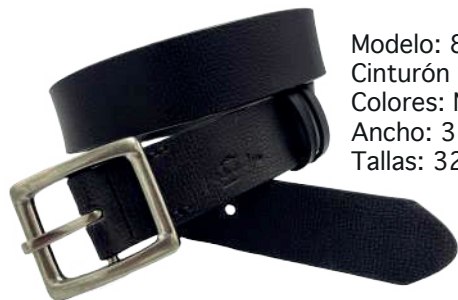
Modelo: 8008 Cinturón vaquero, Búfalo de agua Colores: Negro Ancho: 38 mm Tallas: 32-42