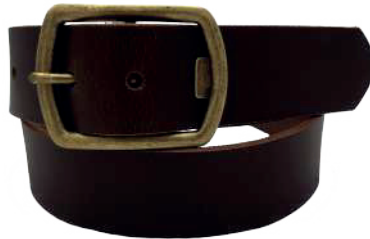
Modelo: 8014 Cinturón casual, Búfalo de agua Colores: Tan Ancho: 38 mm Tallas: 32-42