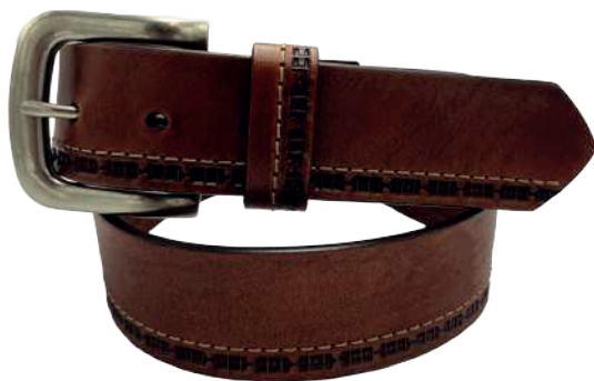
Modelo: 4594 Cinturón casual, vaqueta urka Colores: Cognac, negro y café Ancho: 38 mm Tallas: 30-44