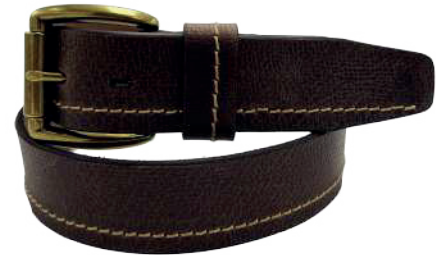
Modelo: 8015 Cinturón casual, Búfalo de agua Colores: Café Ancho: 38 mm Tallas: 32-42