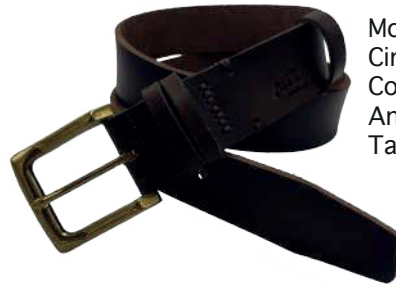
Modelo: 8004 Cinturón casual, Búfalo de agua Colores: Café Ancho: 38 mm Tallas: 32-42