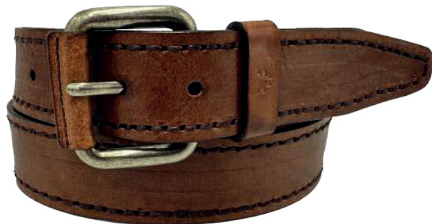
Modelo: 4181 Cinturón casual, vaqueta encino Colores: cognac, negro y café Ancho: 38 mm Tallas: 30-44