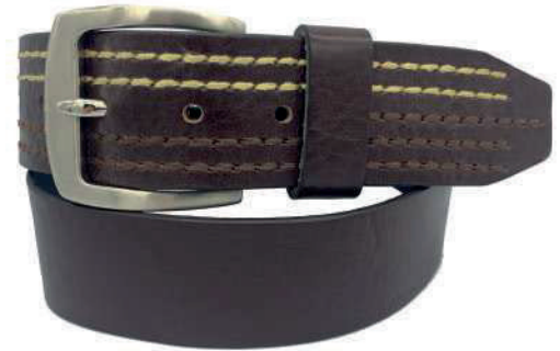
Modelo: 4198 Cinturón casual, vaqueta urka Colores: naranja y negro Ancho: 45 mm Tallas: 30-44