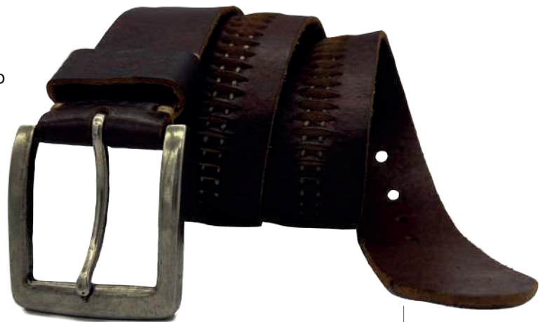
Modelo: 4563 Cinturón casual, vaqueta urka Colores: naranja y negro Ancho: 44 mm Tallas: 30-44