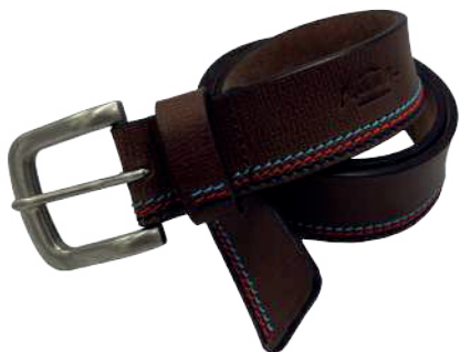
Modelo: 8001 Cinturón casual, Búfalo de agua Colores: Light Brown Ancho: 38 mm Tallas: 32-42