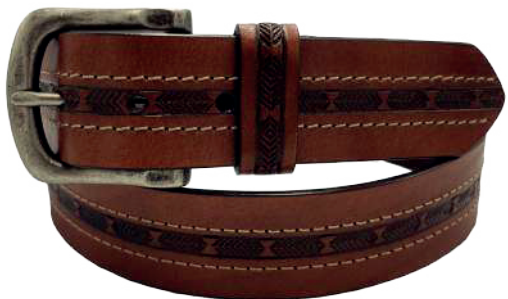
Modelo: 4596 Cinturón casual, vaqueta urka Colores: Cognac, negro y café Ancho: 38 mm Tallas: 30-44