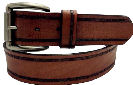
Modelo: 4591 Cinturón casual, vaqueta urka Colores: Cognac, negro y café Ancho: 38 mm Tallas: 30-44