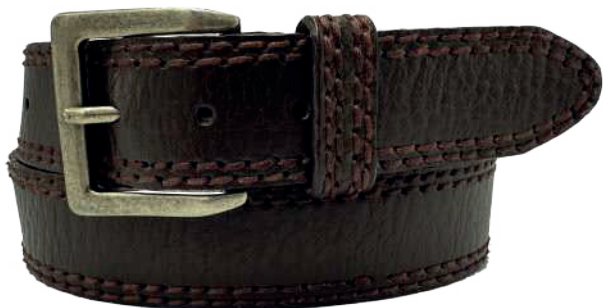
Modelo: 4177 Cinturón casual, vaqueta urka Colores: naranja y negro Ancho: 38 mm Tallas: 30-44