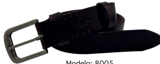
Modelo: 8005 Cinturón casual, Búfalo de agua Colores: Café Ancho: 38 mm Tallas: 32-42