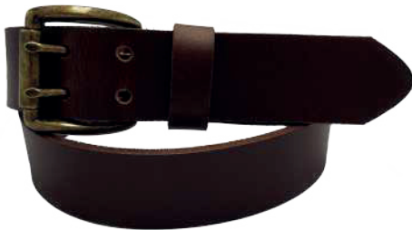
Modelo: 8012 Cinturón casual, Búfalo de agua Colores: Tan Ancho: 38 mm Tallas: 32-42