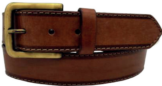
Modelo: 4184 Cinturón casual, vaqueta encino Colores: cognac, negro y café Ancho: 38 mm Tallas: 30-44