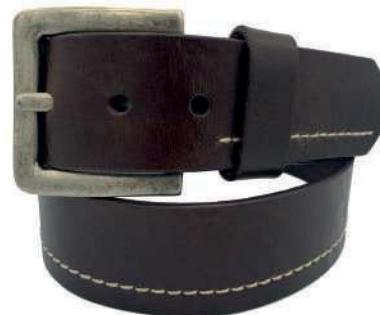
Modelo: 4265 Cinturón casual, vaqueta urka Colores: naranja y negro Ancho: 42 mm Tallas: 30-44