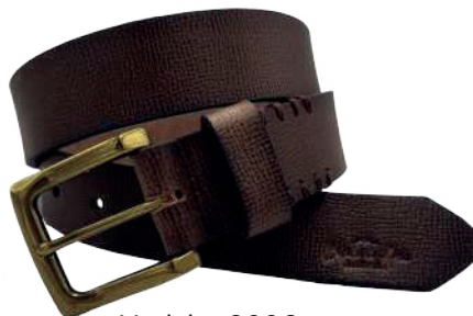
Modelo: 8006 Cinturón casual, Búfalo de agua Colores: Light Brown Ancho: 38 mm Tallas: 32-42