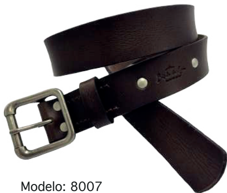
Modelo: 8007 Cinturón vaquero, Búfalo de agua Colores: Café Ancho: 38 mm Tallas: 32-42