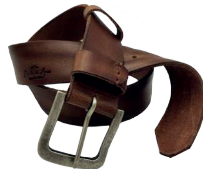
Modelo: 8010 Cinturón casual, Búfalo de agua Colores: Tan Ancho: 38 mm Tallas: 32-42