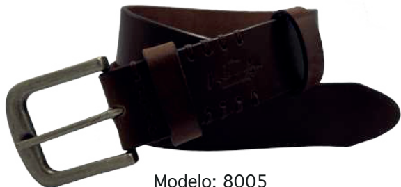
Modelo: 8005 Cinturón casual, Búfalo de agua Colores: Tan Ancho: 38 mm Tallas: 32-42