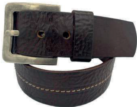
Modelo: 4266 Cinturón casual, vaqueta urka Colores: naranja y negro Ancho: 42 mm Tallas: 30-44