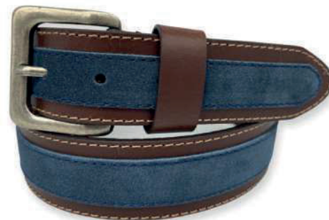
Modelo: 4419 Cinturón casual, piel split y gamuza Colores: café con azul petróleo Ancho: 38 mm Tallas: 30-44