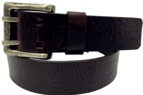
Modelo: 4264 Cinturón casual, vaqueta urka Colores: naranja y negro Ancho: 41 mm Tallas: 30-44