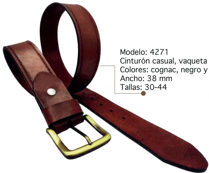
Modelo: 4271 Cinturón casual, vaqueta encino Colores: cognac, negro y café Ancho: 38 mm Tallas: 30-44