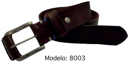
Modelo: 8003 Cinturón casual, Búfalo de agua Colores: Tan Ancho: 38 mm Tallas: 32-42