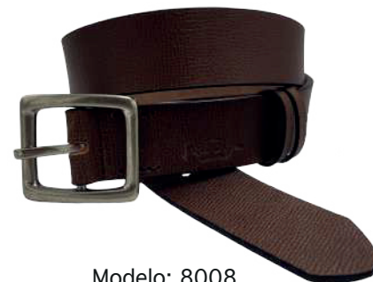
Modelo: 8008 Cinturón casual, Búfalo de agua Colores: Light Brown Ancho: 38 mm Tallas: 32-42