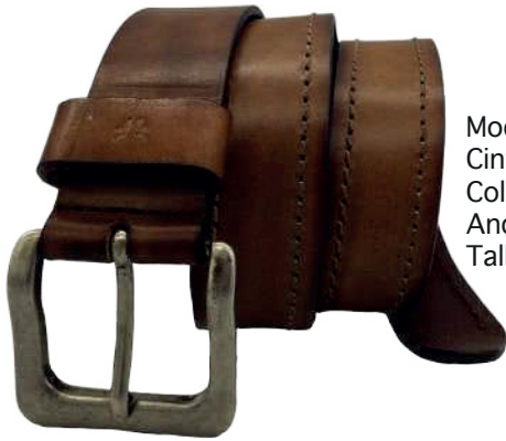
Modelo: 4187 Cinturón casual, vaqueta encino Colores: cognac, negro y café Ancho: 38 mm Tallas: 30-44