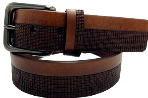
Modelo: 4597 Cinturón casual, vaqueta urka Colores: Cognac, negro y café Ancho: 38 mm Tallas: 30-44