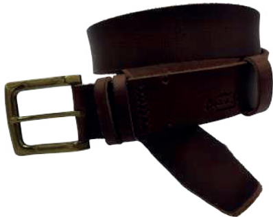
Modelo: 8004 Cinturón casual, Búfalo de agua Colores: Tan Ancho: 38 mm Tallas: 32-42