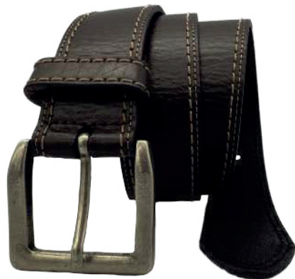
Modelo: 4176 Cinturón casual, vaqueta urka Colores: naranja y negro Ancho: 38 mm Tallas: 30-44