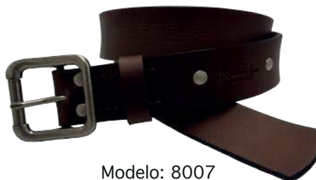
Modelo: 8007 Cinturón casual, Búfalo de agua Colores: Tan Ancho: 38 mm Tallas: 32-42